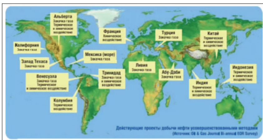
Рисунок 1 – Перечень действующих проектов по странам мира

Для лучшего понимания отличий зарубежных подходов к пониманию МУН от превалирующих в настоящее время в России, стоит обратить внимание на действующие в разных странах мира. Химическое воздействие осуществляется на месторождениях Франции; закачка газа – на объектах месторождений Турции; в Китае, Индии, Индонезии – термическое и химическое воздействие; в Ливии, Мексике, Техасе, Калифорнии – закачка газа; в Венесуэле - закачка газа, термическое и химическое воздействие; в Колумбии – термическое воздействие и т.д.