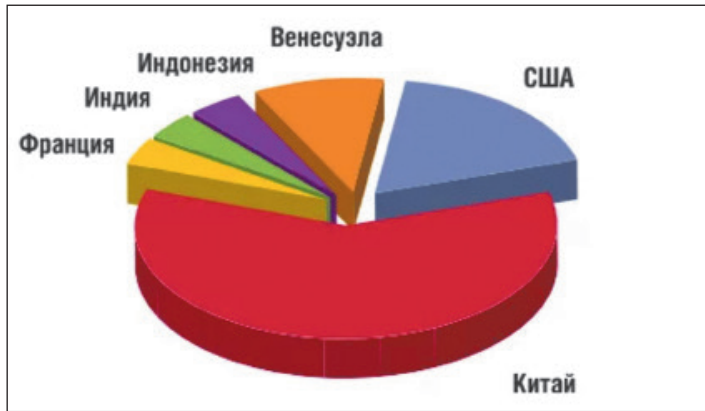
Рисунок 2 – Охват проектами химического воздействия по месторождениям стран мира

Нельзя не признавать существенной разницы по состоянию реализации МУН в нашей стране и за рубежом. В США и других капиталистических странах практически не внедряются физико-химические МУН, хотя число опытных участков для их испытания заслуживает внимания. Рентабельность указанных МУН низкая в связи с высокой стоимостью химических реагентов и невысокой технологической эффективностью всех известных их модификаций. В США ни один проект полимерно-химического воздействия (в том числе с применением биополимеров) не признали экономически состоятельным по сравнению с проектами теплового (термического) и газового (включая воздействие \text{CO}_2 ) воздействий.