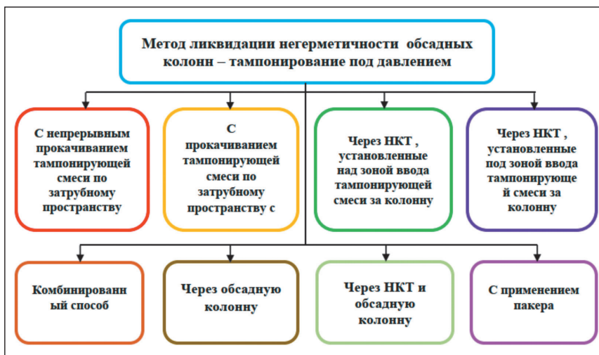
Рисунок 3 – Основные методы ликвидации негерметичности обсадных колонн – тампонирующее под давлением

Используя только тампонажные растворы, невозможно решить проблему успешного проведения гидроизоляции работ. В соответствии с "Правилами производства ремонтных работ", ремонтно-изоляционные работы должны включать комплекс различные операции, таких как определение участка негерметичности, приемистости интервала негерметичности, применение тампонажных работ под давлением и опрессовки колонны (рисунок 3).