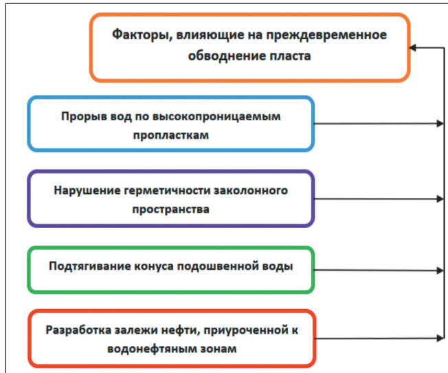
Рисунок 2 – Факторы, влияющие на преждевременное обводнение пласта

Условия разработки месторождения Карачаганак обуславливают преждевременное обводнение, которые не связаны с выработкой пласта и зависят от ряда факторов (рисунок 2) [3].