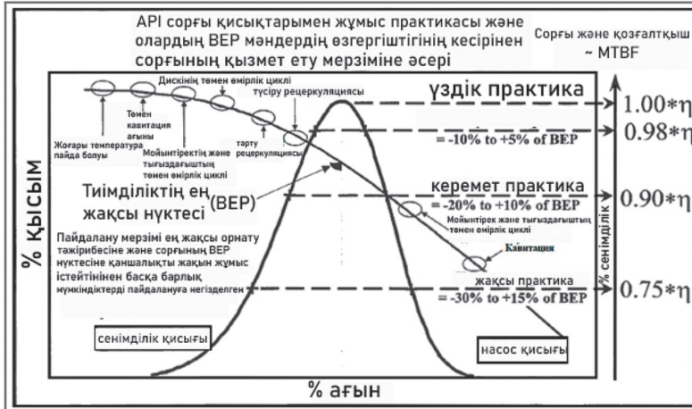
Сурет 3 – Сенімділікті анықтау үшін сорғының қысым-шығыс сипаттамасы [6,7]

R_{KOC} = -10\% - дан +5\% - ға дейін ең жақсы тиімділік нүктесі (ВЕР).